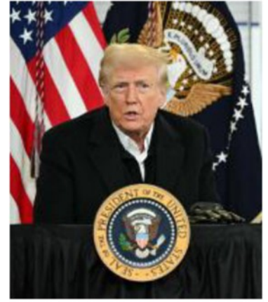
Donald Trump, presidente Usa, 78 anni